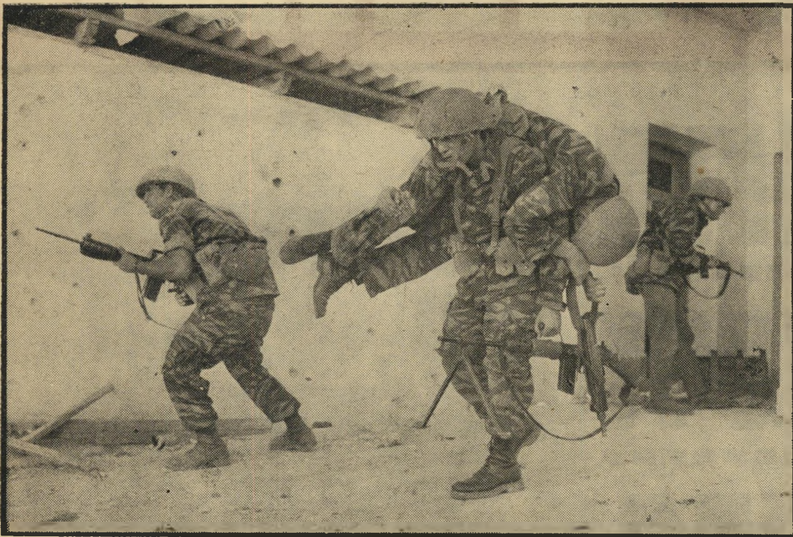
אחת מהתמונות המתפרסמות לראשונה: הצנחנים בקרב על ירושלים

שטח התערוכה: בית יד לבנים בתל-אביב, רח' ויצמן פינת רחוב פנקס (סוף קו 5) התערוכה פתוחה יום-יום משעה 10.00 בבוקר עד 23.00. הזמנה מרוכזת של כרטיסים טלפון 240337 27.7.67 — 11.8.67