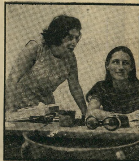
עם אמא שדאגה לכל, כולל טבעת-נישואין מיר, חדת, מזהב לבן, מעשה-ידי צורפי משכית.

מ זכרונות שמכחינות יחסים, זוהי קפיצת דרך גדולה. כי המלחמה מעמידה בפרור פורציה את הדברים. דברים שהיו חשובים קודם מאבדים את חשיבותם. כי המלחמה מבודדת נורא. האדם יכול להיות מוקף גידור של חברים, אבל הוא נשאר אדם, עם מחשבותיו הטובות והרעות, לגמרי לבד. ואז כשמוצאים אדם שני, יש לזה יותר חוק. כרוך שסוגי-חיים אחד נגמר אצלי, ויחל סוג חיים חדש. לא עברתי שום היסטוריה ופחד של ויתור על סיגנון-חיים קודם. אני לא מתחרטת על אף רגע שחייתי במסגרות חיים אחרות. אני לא הפסדתי זמן. כל הדיברים שעשיתי תרמו לי והעשירו אותי. הכרתי אותו בשבטה. זה היה שבועיים לפני פרוץ המלחמה. אף פעם קודם לכן לא עמדתי להתחתן. תמיד אמרתי: כשזה יקרה, זה יקרה. היה לי חבר וידיד שמונה שנים, הבמאי מיכאל קקויאניס. הכרתי אותו ב-פסטיבל בקאן בשנת חמישים ותשע. כל שנה הייתי נוסעת אליו, ליוון, לכמה