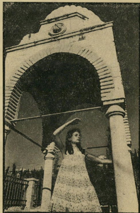
בין העמודים אשר מחוץ לחומת־ירושלם, מדגימה אראלה את השפעת הנופים.

מראה עד כמה הוא הצליח בכך. אֵיך זה להדגים שמלות כאלה, באמצע הרחוב של ירושלים העתיקה? דבר אחד ברור: הדוגמניות גנבו את ה־הצגה מכל האחרים גם יחד. בכל מקום בו הופיעו — נעצרה תנועת המטיילים העצור, מה, כשכולם נועצים בהן עיניים משתאות. תושבי העיר הערביים דווקא הסתכלו ב־