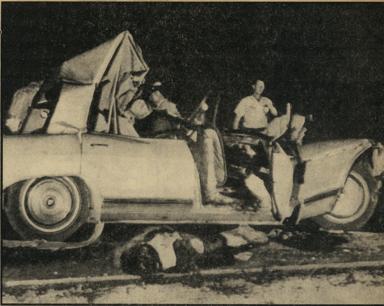
ברקע נראית מכר נית הביואיק ה מרוסקת של הכוכבת, כשבחזית התמונה, עטופה בשמיכה, מונחת גיין. לידה היו שושה מתוך חמשת ילדיה, אך, כפי שהסתבר אחר-כך, הם ישנו במושב האחורי בזמן התאונה, לא ראו מאומה.