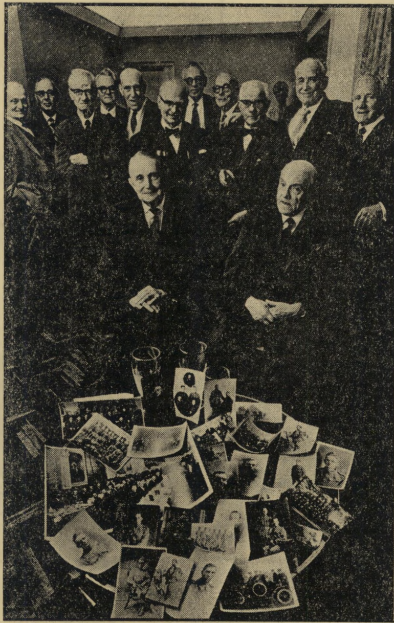
כניס כובשי ירושלים בלונדון לחיי מוטה גורו לחיי אדמונד הנרי הינמן אלנבו לחיי המלכה

כמה אנגלים קשישים רצו השבוע לשגר מיברקי-ברכה לכובש ירושלים אלוף-מישנה מוטה גור. הם לא עשו את זה. לא מפני שהם לא ידעו שהוא יושב, במקום בירו שלם, בניו יורק, כיועצה הצבאי של משלחת ישראל לאו"ם. אלא פשוט מפני שהם אנגלים