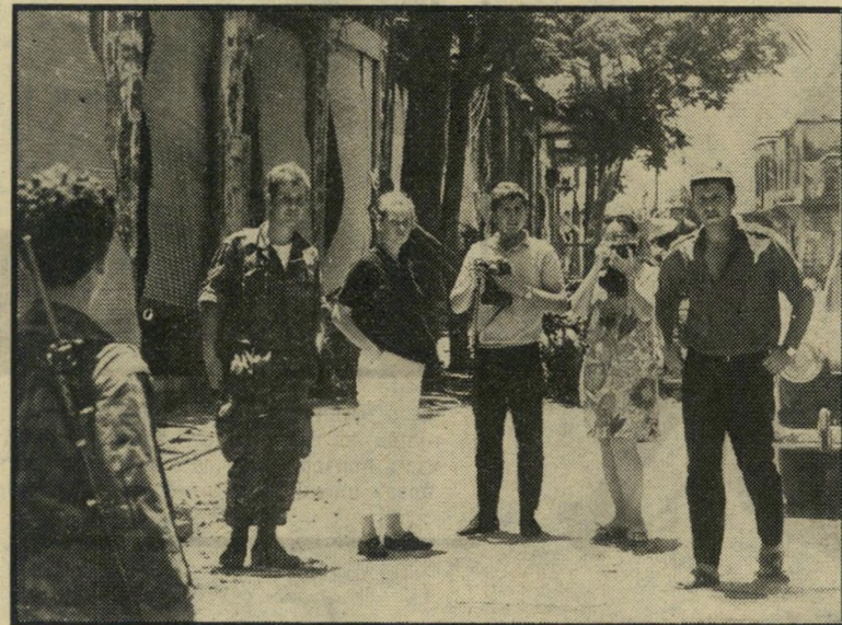
מציידים בכל האביזרים, מנציחים את מראה העיר הי מורית. הם עושים חנייה קצרה, בדרך למעיין הבניאס.

בכניסה המערבית של העיר מתו נשא בניין עצום, על גבעה יפה