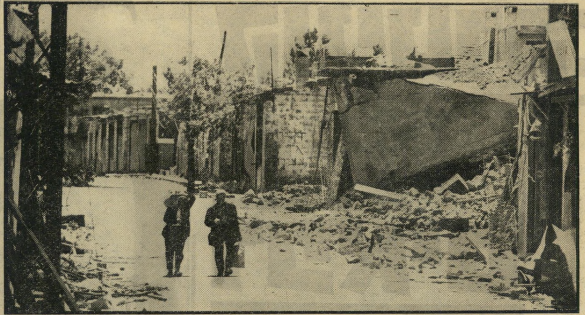
העוצר בקוניטרה חל רק על התושבים הערביים שנותרו בעיר. בין עשר ל-12 בבוקר, מותר להם לצאת מהרובע בו רוכזו, לשאר חלקי העיר, זקנים אלה חוזרים לרובע שלהם.