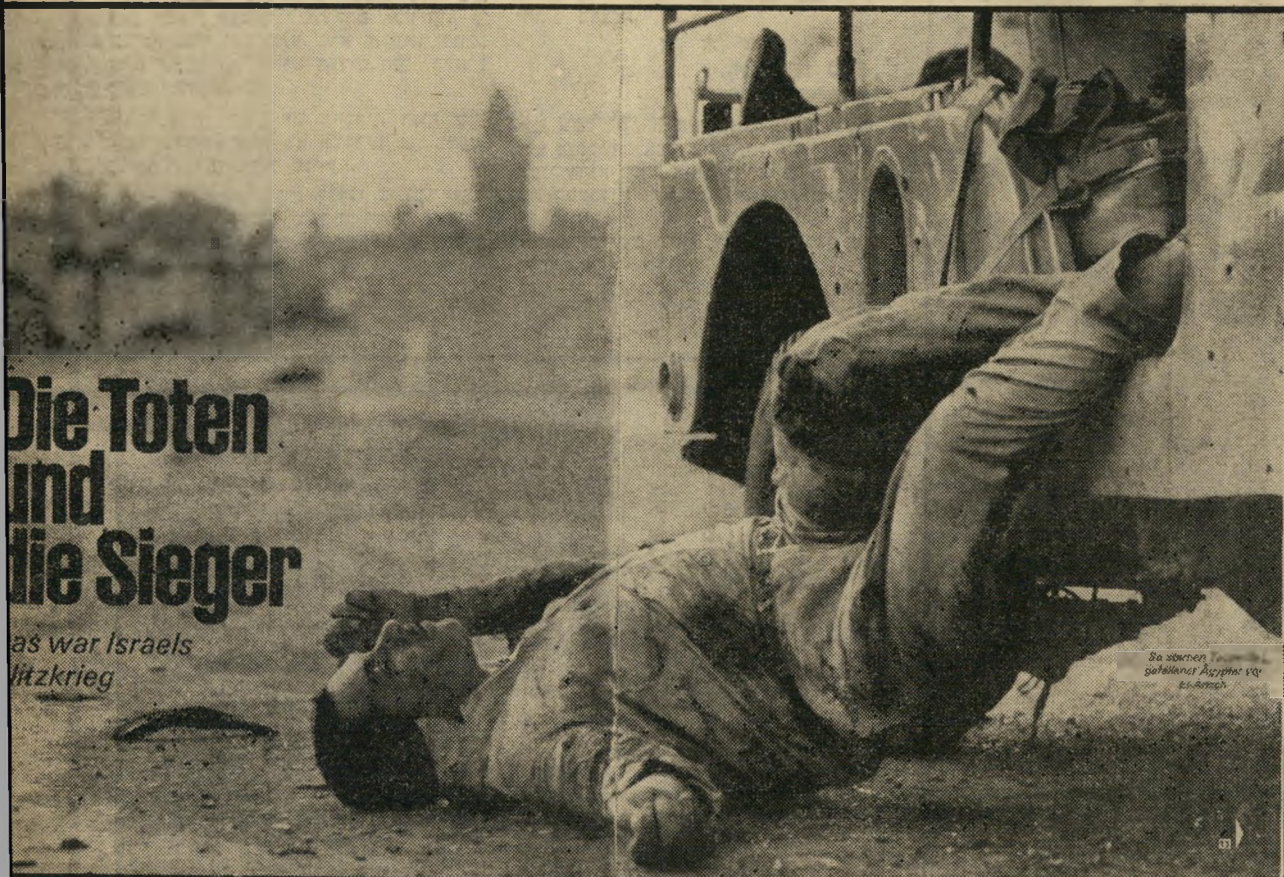
Die Toten und die Sieger Das war Israels Sittkrieg