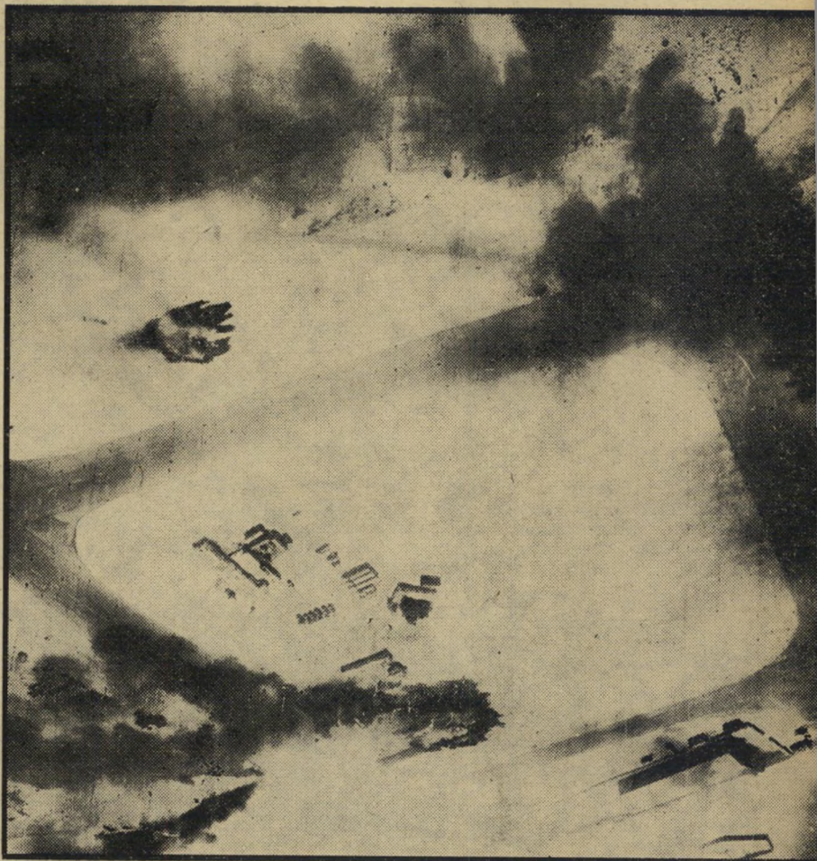
מאה מאנקים וכלי רכב של האוייב בחמונה אחת - שטח בחצי-האי סיני אחרי פעולת המוסים (שואל) - שדה-תעופה מוכפץ (למעלה) ומוסים שהושמדו (למטה)