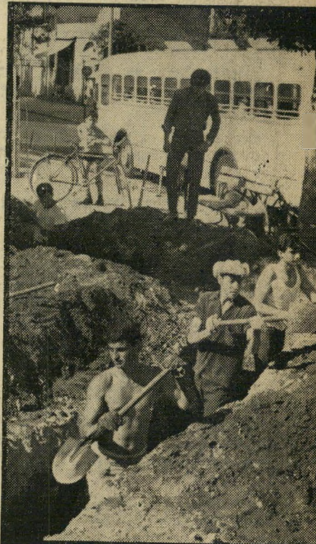
שוחות-ימון בתל-אביב זיעה חוסכת דם

אזרחי ישראל הוכיחו השבוע שיש להם עצבים של ברזל. הם לא רק נאלצו לעמוד ב-פני השאלה הגורלית "מה יעשו המצרים?" אלא גם בפני השאלה הגורלית לא פחות: "מה תעשה — או לא תעשה — ישראל?" כלפי חוץ, הכל התנהל כרגיל. הערים לא הואפלו, עסקי-הבידור לא הושבתו, השרותים האזרחיים נמשכו כסידורם.