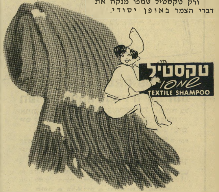
תוצרת ביח"ר נקה בע"מ * המפיצים חב' נורית בע"מ

כבסי אותם בקצף הרך והעשיר של "טקסטיל שמפו" רק כביסה יסודית מגינה על בגדי הצמר מפני העש ורק טקסטיל שמפו מנקה את צברי הצמר באופן יסודי.