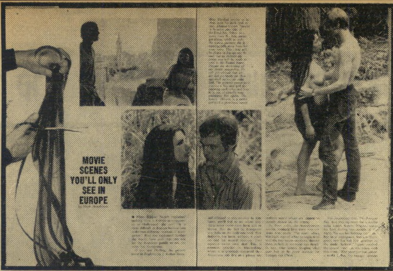
המאמר עם תמונות, "פורטונה" בירחון "יגואר" סצינות שתוכלו לראות רק באירופה

מונגולה עצמה, גיבורת הכתבה המצולמת יצאה השבוע לאירופה, כדי לפתוח בקאריי- רה של תשפנית ישראלית מהוללת. היא לא ידעה כי באותו שבוע עצמו היא האדו-