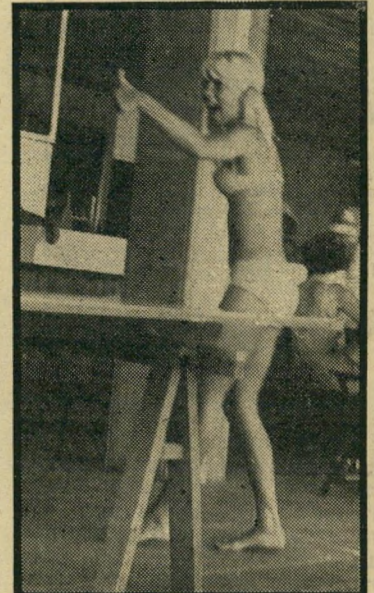
פינג ופונג הפך לאחד מעיי סוקיה העיקריים, בזמן שחשובי המדינה ציפו לה. הזמרת והאופ- נאית התגלתה בהזדמנות זו, כחתיכה סוג א.