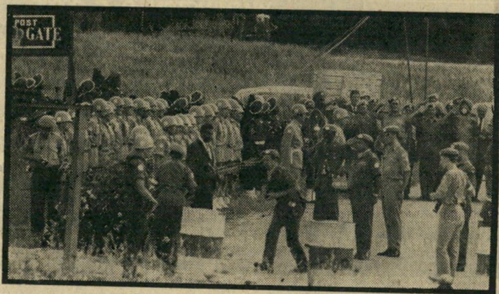
חייה-חירות של האו"ם מפנה את הרצועה

שוב אין ארצו רואה את עצמה קשורה לקיים את החייבות שלוש המעצמות המירביות משנת 1950, בדבר שלמות הגבולות של ישראל ושכנותיה. פירוש הדבר המעשי היה: היתר לישראל לפרוץ גבולות אלה.