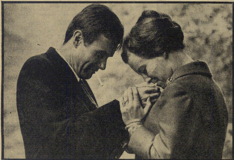
יורשת-עצר מארגרט זחתן הנרי אין דלק, יש שמות

הוא גילה כי אין כל חשיבות לרקע הכלכלי, החינוכי, הדתי או הגזעי של ההורה המכה את ילדו. במידה ומכים, כולם עושים זאת. עניים ועשירים, בורים ואקדמאים, לבינים ושחורים. האמריקאי המכוער העושה זאת, יש לו, בדיוק כמו לכל הורה אחר בעולם העושה זאת, סיבות שונות ומשונות.