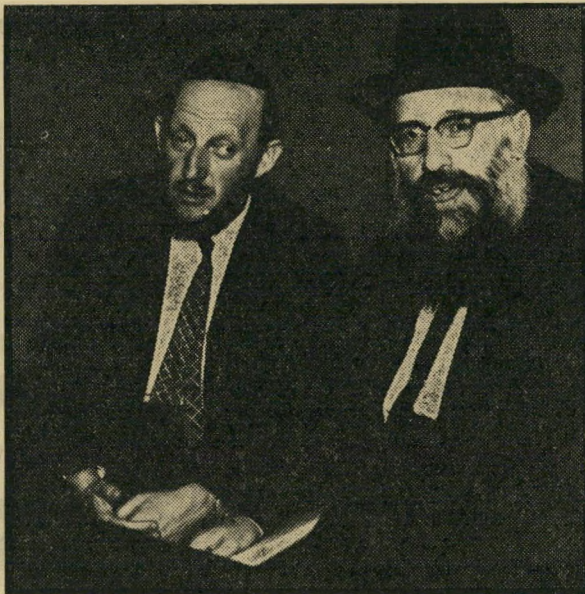
עסקני אגוויי פרוש וגרוס

— שעה אחרי שעה — תוך מתיחות נוראה ועייפות גוברת — כשרגעיי-נצחון מתחלפים ברגעים של יאוש חסראונים — כשהלם חשמלי ועיסוי-לב-פתוח, ושאר כליהנשק של המדע החדש ביותר, מופעלים בידי בני אנוש להצלת הלב של אשה אחת? כי יתאר את רגשותיהם של רופאים אלה, כאשר נוכחו לדעת כי המאבק ההירואי נכשיל, כי כל הידע וכל החידושים עדיין לא הספיקו כדי להציל אם זו לילדיה? מי יתאר את תחושת הסיכרון, חוסריהאונים — ומועד לכל, העיייי פות הנוראה של אותו רגע? את הרופאים האלה רוצים עסקניהדת להביא עכשיו למשפט פלילי, על כי באותו רגע קודר, ליד שולחןהניתוח המגואל בי דם, שכחו לרשום על טופס של נייר, עם מן הגוף לשם עיסוי, וכי לאחר מכן נלקח לשם בדיקת הסיבות שגרמו לכשלון. ומי הם המאשימים? האם איבד מישהו מעסקניהדת אף רגע אחד של שינה באותו לילה הירואי? האם כל חוכמתם וכל פיקחותם וכל ערמוניותם של סוחריהדת יכלו להעניק אף רגע אחד של חיים לאותה רפנית אומללה?