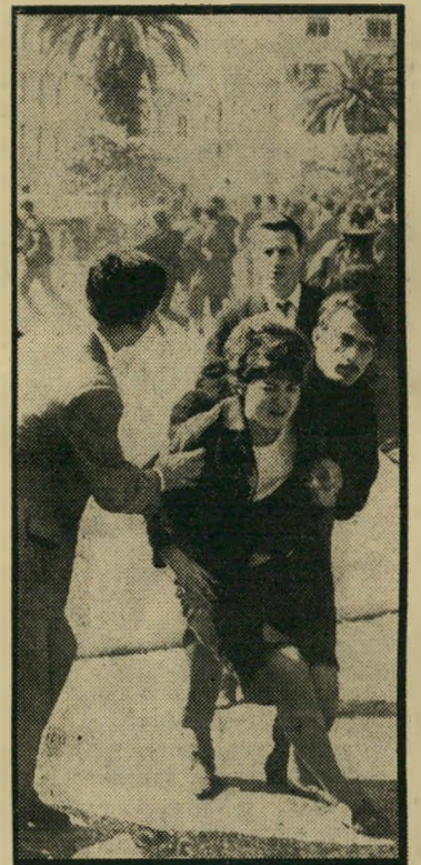
הפגנה נגד המלך באתונה מכה לחרות, בחג החרות

לצורך זה כרת צ'רצ'יל ברית עם שרדיו המישטר הפאשיסטי, ששתף פעולה עם ה-