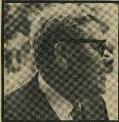
נוסע סאלינגר "אסור למכור"

* כמה מהמוראיינים מסרו את שמם אך ביקשו, לא לפרסמו, בגלל חששות שונים.