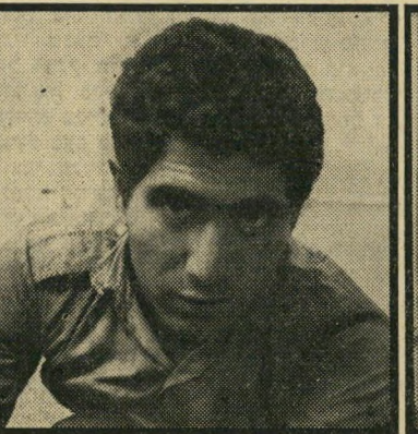
מכונאי זערוך "יש כאלה שנדפקים"