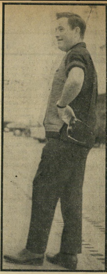
קצין בירור חרל"פ "מה אפשר לעשות?"

שלום מאז הפלגתה הראשונה: "מכרו אותה וזה. מה יש פה עוד לדבר? אנחנו רואים כי זה הפרנסה שלנו. הבטיחו שעבירו אונייה לאוניות אחרות. ככה אמרו המנהלים. הלאי וזה יהיה ככה". בעירום שם* (29) ממוצא מרו-קאי, העובר שנתיים כמסגר-מכונות על שלום: "אני מהגר, עוזב את הארץ. אעבוד בחו"ל במיקצוע שלי. אם אני חושב שצריך היה למכור את האוניה? אני חושב שבכלל