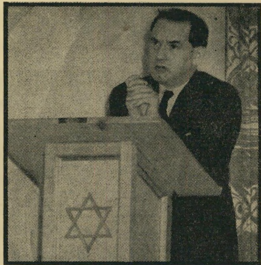
שגריר הרמן האירגון

אט"ט, ככל שקרב מועד ההפגנה הגדולה, החלו כרוזים, גדושים בתיאורים מזועזעים, לכסות את שדרות מדיסון, את השורה החמישית ואת יתר המרכזים הצפופים של מאהטון בניו-יורק. כדי ליצור את הרושם הדרוש, סופר בכרוזים שהודפסו באנגלית, כי בישראל מתעללים, בין השאר, גם בגופות של ישישים שמתו מוות טבעי, וכדי לשלח את