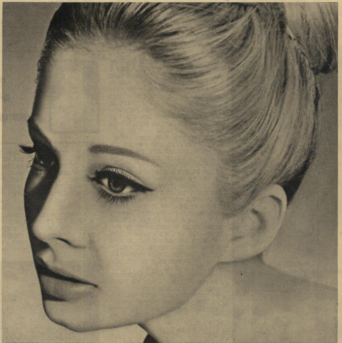
שחם לבינסון אילון

Silk Fashion Compact אבן איפור בתרכובת מאוזנת של קרם מרענן ומרכך, ואבקת איפור עדינה, לליטוש אחרון של האיפור המושלם.