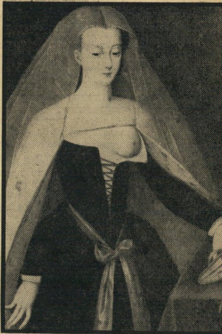
הליידי היפה* זקן לסנטר פרעה

לא נפקד מקומה של הפרעה-הקבכה חאת' שפסות, שהוביקה לסנטרה זקן מלאכותי ו'