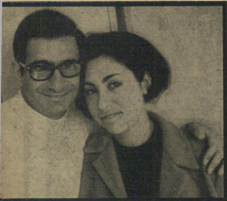
צדוק סביר ויפה

כשהזמר החקין צדוק סביר חזר אר צה, לפני חודשיים, הוא הודיע שהוא כבר בשל לנשואין ומי שמעוניינת לעזור בי עניין, תתקבל בברכה. היו לו כמה נסיונות בשטח הזה, עם