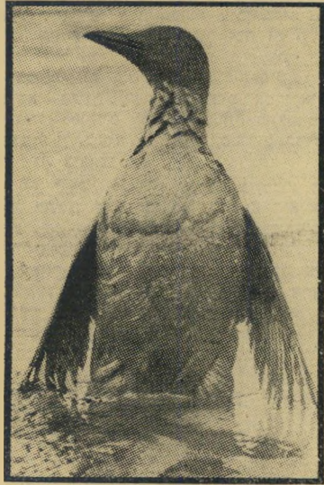
ציפור מבקשת עזרה שני ימי עבודה

ההצעה המשעשעת ביותר היתה של רב-סרן בדימוס. הוא הציע להשליך על הנפט צמיגים ישנים ובוערים. הצעה זאת לא רק