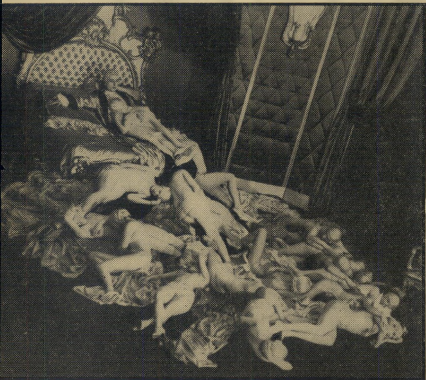
"אהבותיו של קאזאנובה" — את המין