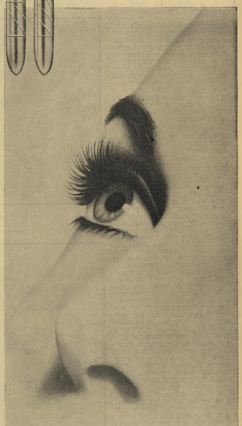
שחם לבניסון אילון

לא תאמיני למראה עינייך! שחור, חום וגווני אופנה אחרים לרשותך.