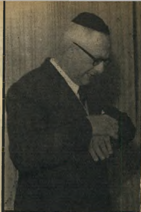
פרשן רוזנטל ישו + אלטלינה

כי הרכב ועדת החקירה עצמה ייקבע עלי- ידי נשיא בית המשפט העליון.