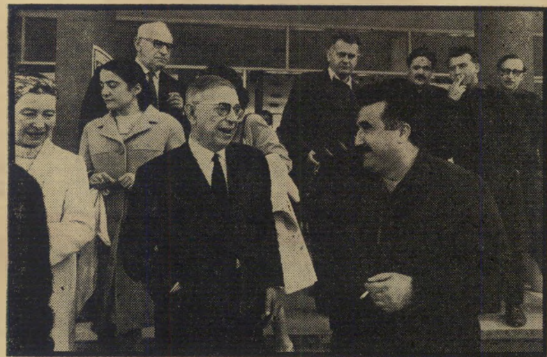
שלום כהן וז'אן-פול סארטר *

העולם הזה, שבועון החודשות הישראלי המערכת והמנהלה: תל-אביב, רח' קרליבך 12, טלפון 301345, ת.ד. 136 • מען מברקי: עולמפרס • דפוס משה שהם בע"מ, תל-אביב, רח' פין 6 • גלופות: צינוקגרפיה כספי בע"מ. • העורך הראשי: אורי אבנרי • המו"ל: העולם הזה בע"מ.