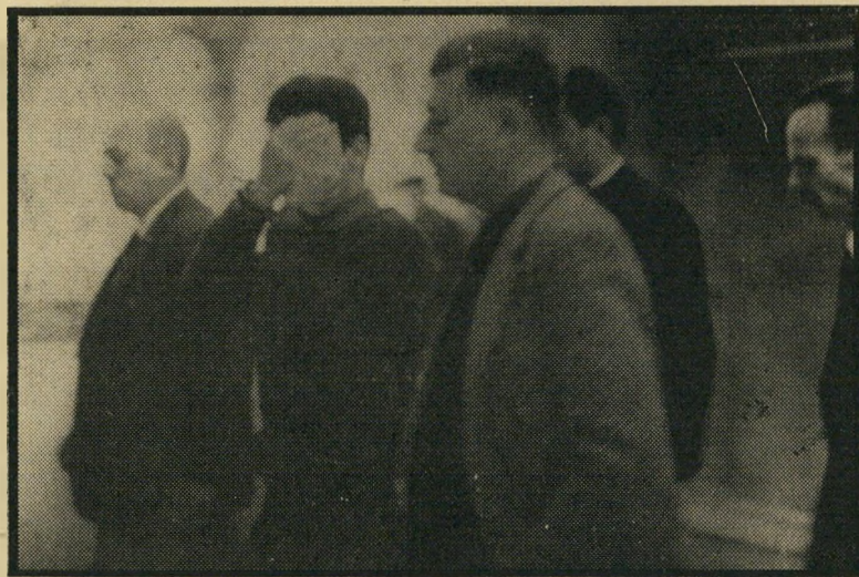
חשוד לזי (מפתיר פנים) מובל על ידי שוטרים. "אני כבר לא יכול —"