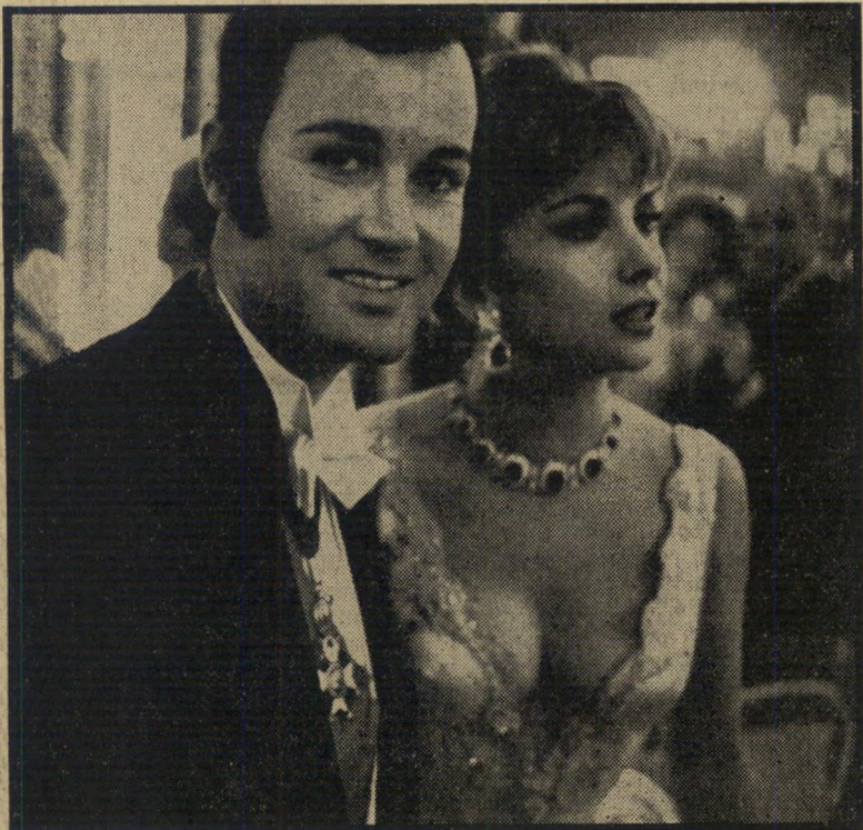
לודו וקרופ ידיות איטלקית-גרמנית