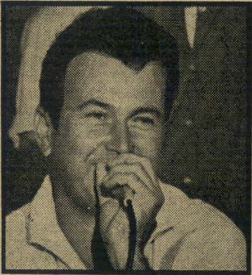
קריץ — והיהודי עזוב