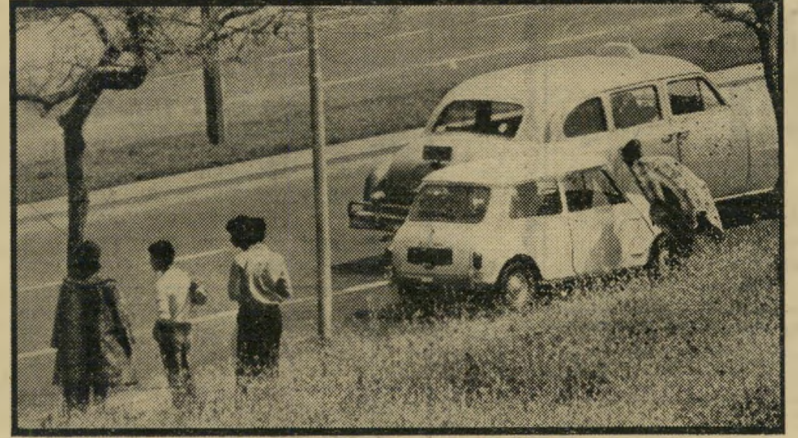
2. ויכוח על מחיר