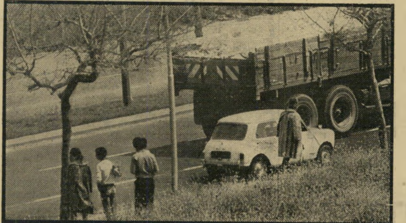
1. המכונית נעצרת