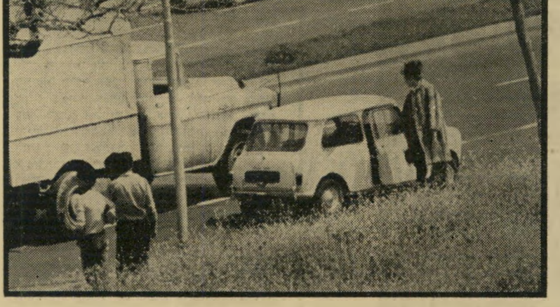
3. הנהג פותח