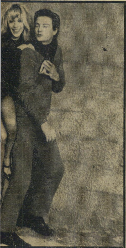
אילי הנוער והיפהות. גיוזי, יושבת וחור בלבנה. נשונת טי בנות הספסעשרה של ישראל. בתמונה שצולמה עלי

ב כל מקרים שבו מופיעה גיוזי, היא לבושה בחצאיות הכי קצרות — ומלי וזה בשני הבחורים הכי גבוהים. וגם הכי יפים: כי האחד הוא אריק אייני שטיין, זה שכל הילדות בנות ה-15 קוראות לו אילי-הנוער, ואילו השני הוא שמוליק קראוס, שהוא רשע מקצועי. הוא הספיק כבר להיות הגנגסטר בסרט חור בלבנה, והאח בוזגלו בפורטונה. אך סיפיריחסי עץ גיוזי כץ יפה מכל חסריט: גיוזי הגיעה ארצה מארצות-הברית לפני כארבע שנים לביקור קצר, והתאהבה בשמוליק, שהיה נשוי. היא המשיכה לאהוב אותו אחרי שהתגרש וחי איתה באושר לנצח, והמשיכה לאהוב אותו כשפתאים התחתן לה עוד פעם עם מישהי אהרת לגמרי. והיא כל כך המשיכה לאהוב אותו, עד שלבסוף התגרש שוב פעם לכבודה, ומאז הם שוב ממשוכים לחיות יחד באושר לנצח. הם גרים להם בדירת-יג המסקיפה אל הים, ומוקפים בעדה של חתוליל סיאמיים. ולשם היה אריקאינשטיין-אליל-הנוער בא לי בקר אותם. ואז, ערב אחד, קרה הדבר: הם שרו יחד להנאתם, ולשם שעשוע הקליטו עצמם על הטייפ. ואז (זה נשמע כמו סיפור,