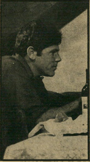
בסרם כוחה של פרוטקציה

רופא, רפא את עצמך! ברמת-גן התנגשה מכונית במכוניתו של רופא-שיני