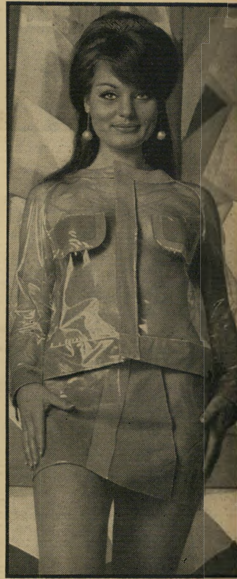
החורף בעיצומו, אך השבוע פורץ סמה כבר אפנת העתיד של החורפים הבאים: יותר קצר, יותר שקוף.