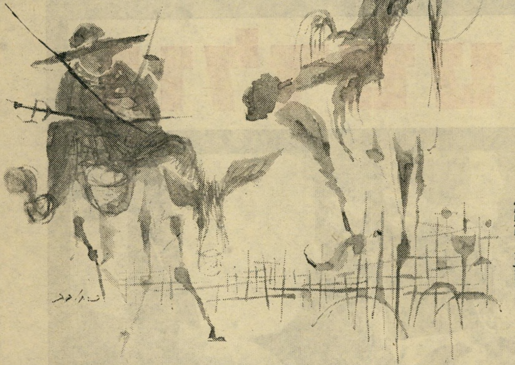
פרוסים : אליאב