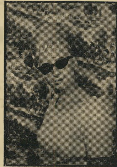
הזוהרת בתמונה למעלה, בדמותה החדשה ושערה המחומי צן, בתמונה למטה מראה את פרלה כבחורה סולידית ושקטה לפני שהפכה ליצאנית.