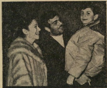
שריף, אשה וכן

אלה תולדותיו של מישל שלהוב בראשי פרקים. רק שהיום הוא כבר בן 33 וידוע יותר בשם הברד שלו: עומר שריף . ואל הברד הגיע, כמובן, בעזרת אשה. הלא היא פאתה חמאנה , כוכבת כסף-הכסף של מצרים. והיא כל כך רצתה לקדם את