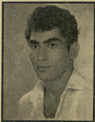
נאשם ארמי התעופף באוויר —

מיהוד נסע הארץ לאור־יהודה. השעה הייתה קרובה לחצות ורחובה הראשי של אורי יהודה, רחוב ההגנה, החל מתרוקן מאנשים. הארץ נכנס לרחוב, והחל נוסע הלך־ו־חוזר לאורכו, במהירות מסחררת, תוך כני