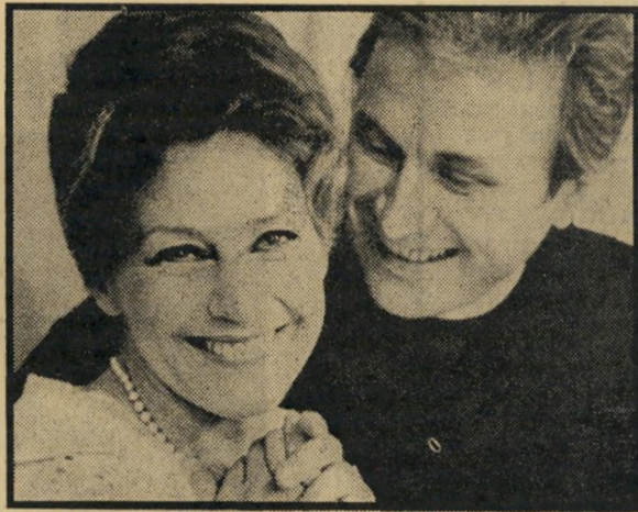
מאריה של ובעלה

אם מדברים על שחקנים יש עוד אחד שהיה לו מה להגיד. זה ג'ורג' סקוט ששיחק את אברהם אבינו ב־סטט התניף. יש לו נסיון בחיים. ארבע שנים היה קברן צבאי ויש לו 1.80 מטר, 5 ילדים ו־3 נשים לשעבר. ומה דעתו על נשים? אומר סקוט הגדול: כל גבר צריך אשה. זה כמו אוויר לנשימה.