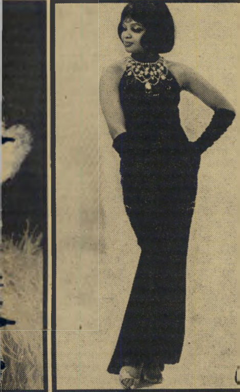
— ואלה באות: מארחות יבוא אמר

מצליחות בכך, הן, למרבית הפלא, הברדניות הערומות של צברה: היתה שם מארחת פנטסטית, ילידת מרו' קו, שוש קראו לה. כולם אהבו אותה, והיא שיעשעה את כולם ובידורה את כולם, עד שיום אחד בא לשם אמריקאי צעיר, וכשהוא ראה מה זה רמה של שעשועים — הוא הת' חתן איתה מייד, ומאז היא חיה איתו חיי' אושר באמריקה, כאשתו החוקית.