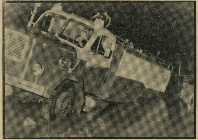
מכונית-כיבוי בשכונת מונטיפיורי — סוקד מספר אחד