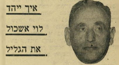
וד פרישה הזכורה עדיין לרבים, כי עיקר לערביי הגליל, היא הפרשה של