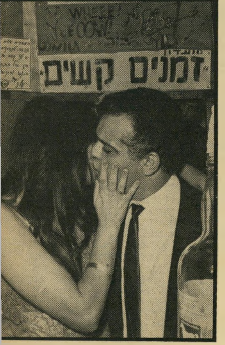
בוסי ואדווה ביום הכלולות

כולם ידעו שבזמן האחרון היא לא מתר'אה עם אנשים, והתעניינו לדעת מה קרה לה. למתעניינים היא סיפרה שהיא משתתפת בחוג של ספיריטואליסטים, ובחוג נכנסים האנשים לאקסטזה ואינם יודעים מה קורה איתם. בבוקר אחרי אחת הפגישות של החוג, היא מצאה על גופה את הסימנים הללו, ואינה יודעת מאיפה באו לה.