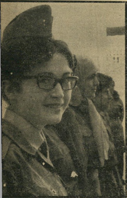
סטודנטית במישמר האזרחי "נשק! תנו נשק לפועלים!"