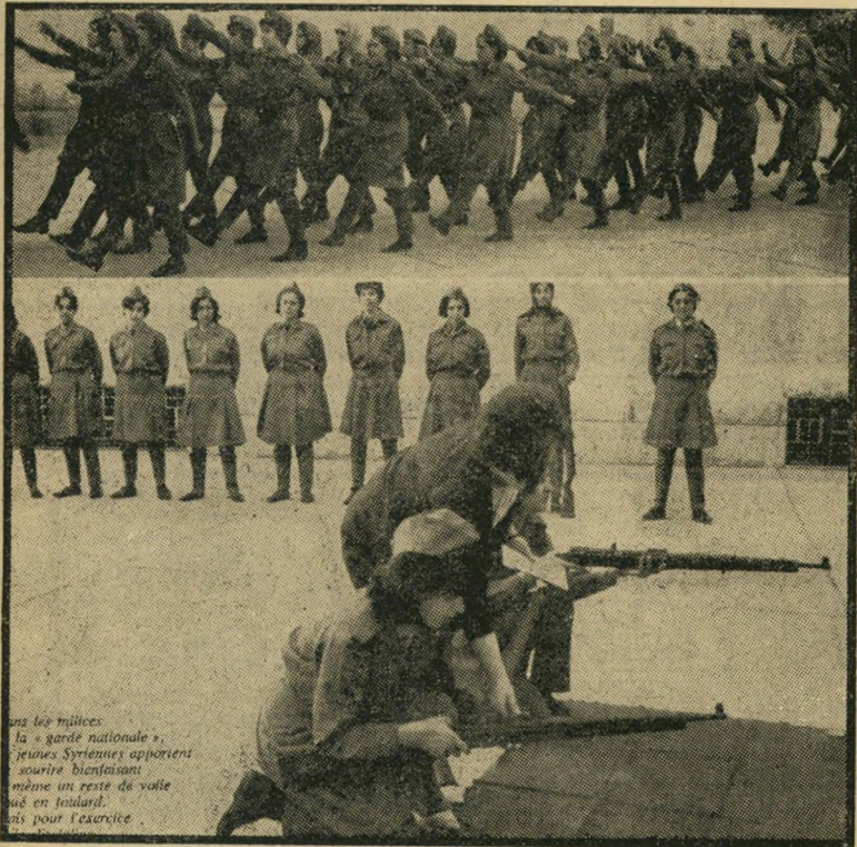
ח"ן סורי מתאמן בתרגילי סדר ונשק גם הצאית, גם מכנסיים

מדיכחה את יחידות הח"ן של ג'ונדי היא פשוטה: "מעמד שווה פירושו חובות שוות!" כאשר החלו האימונים הראשונים ברובים מיושנים, ובתרגילי סדר, חיפתה ההתלהבות המהפכנית על כל הבעיות, אולם כאשר עבר השלב "הפרטיזני", התעוררה בעיה רצינית: מה יהיו מדי הח"ן הפועלי? היו שתי הצעות: להלביש את הבנות מכנסיים; ולהשאיר אותן בתצאיות. לבסוף התקבלה פשרה: בנות הח"ן של ג'ונדי לובי שות מכנסיים ארוכים — ועל המכנסיים הצאית.