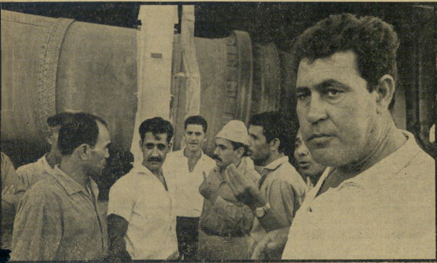
פועלי „שמשון“ ליד המכונות המשותקות אין מיסים