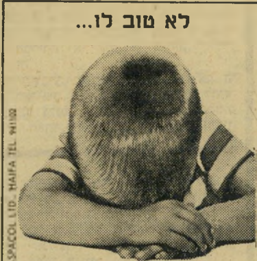
לא טוב לו...

„שנים קטנים הולכים לבית-ספר. שלושה יותר קטנים הלכו לגנון. עכשיו, כשאין משכורת, הוצאתי אותם, כי זה עולה