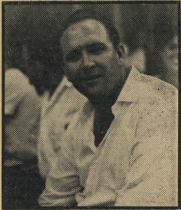
נאשם אמסטרדם החובע יצא