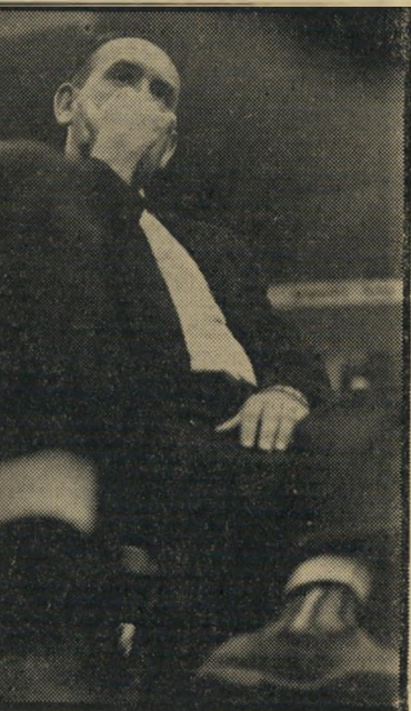
נאשם מינצר השופט התפטר