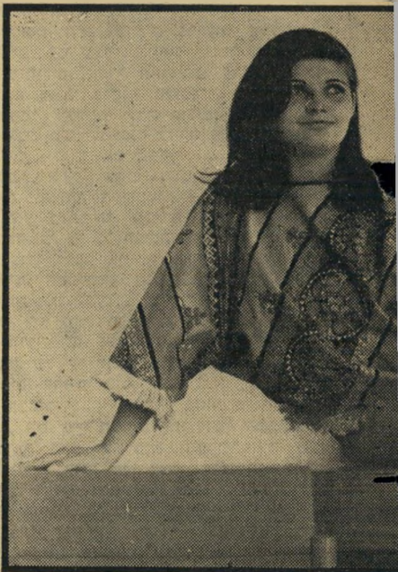
ה, שהופיעה בסצינת-עירום בעליזה מזרחי (משמאל), ית את חרות, במאבק בין הנהלת התנועה לאופוזיציה.