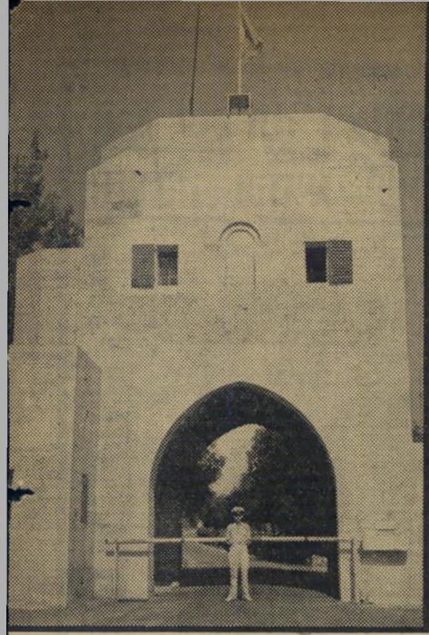
הכניסה לאמה האשקפינים