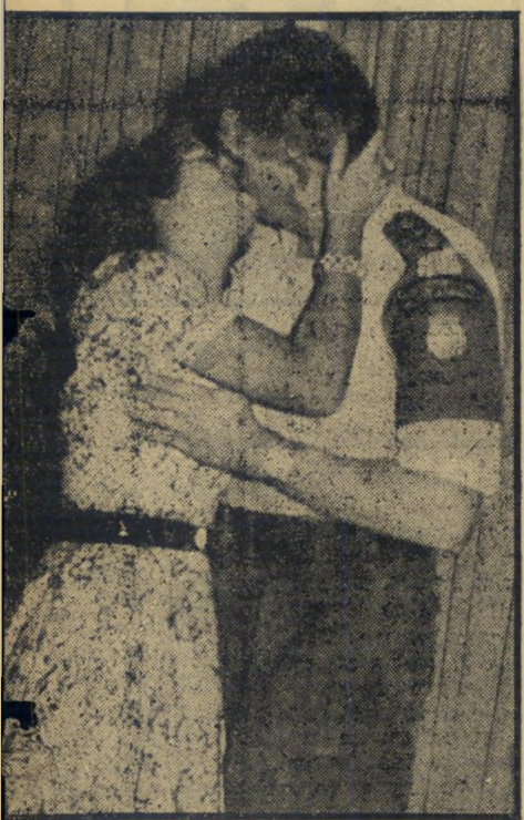
נשיקה לדוגמה באר תל-אביב: נערה ישראלית וקציין או"ם. תמונה ש" צולמה בי