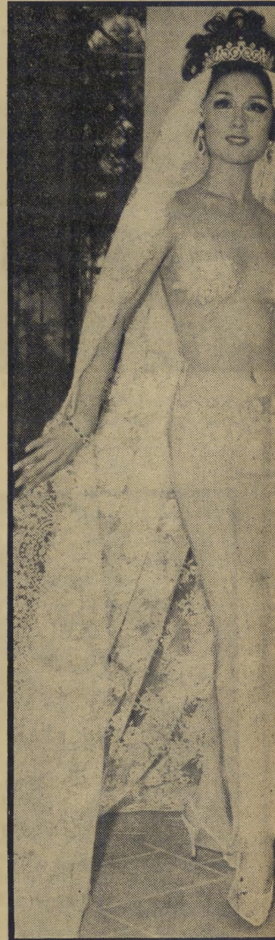
כזה בלבוש חוה בטקס מודרני