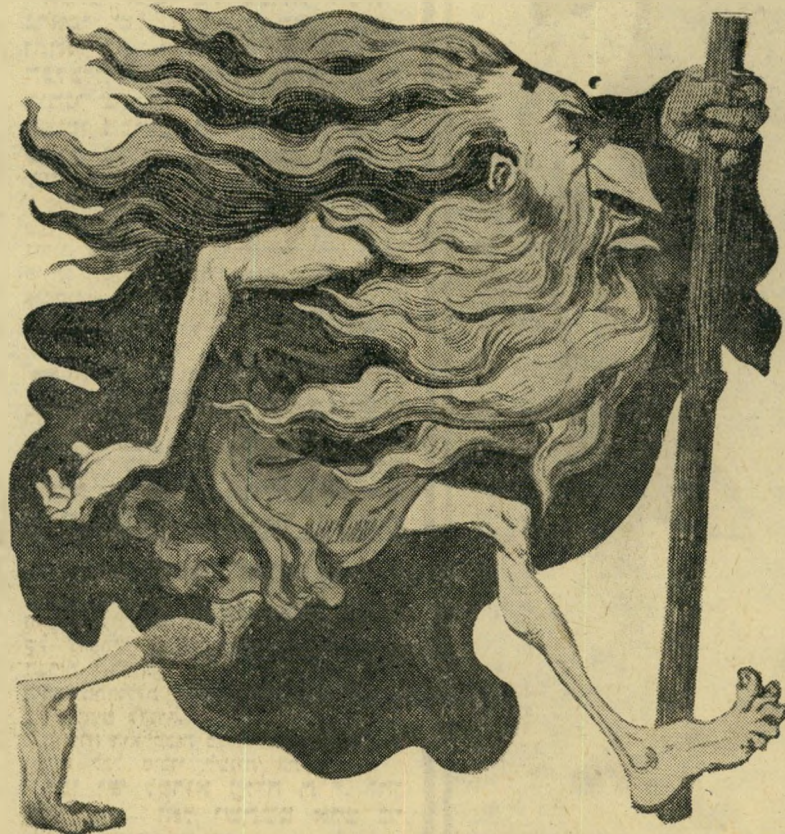
היהודי הנווד: קאריקסורה של גוסטב דורה (1852)

כאשר אלה יורדים — כאשר אלה חושבים אפילו על הגירה — הרי זה אות לבשבר עמוק. משבר שהיה צריך להועיק אף את האזרח האדיש והשאנן ביותר שבק