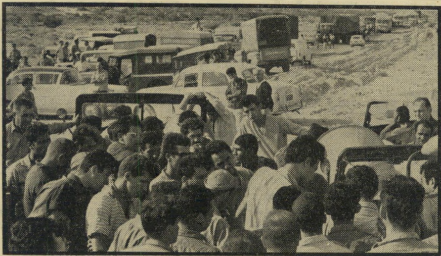
תושבי אילת חוסמים את הכביש