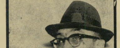
ח"כ מרידור בחינות באזיקים

כפינת הרחוב. לא רק במראה פניי דמה לויבסנסקי. הוא דמה לו גם בפני מיותו. את החגיגות הפך לעקרונ חיים, שי גבל לפעמים בדון קישוטיות. את עקרונותיו קיים בצורה האישית ביותר. לדוגמה: הוא